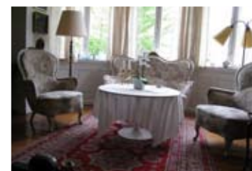
fra i-SITs brugerundersøgelse. Se i-SIT rapporter på www.designconcern.com eller www.i-sit.dk