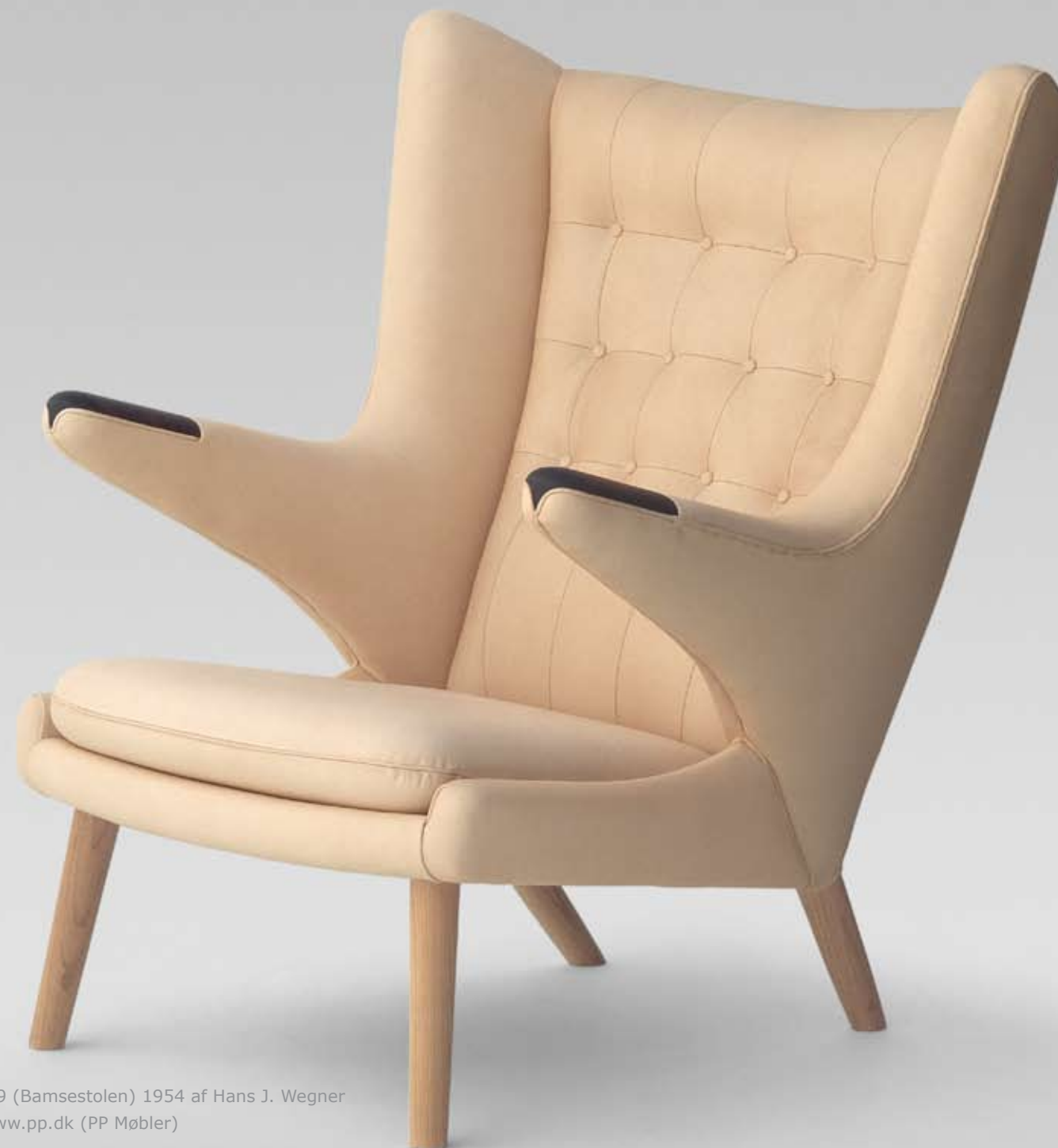
Model 19 (Bamsestolen) 1954 af Hans J. Wegner

83-årig kvinde med smerter i ryg og knæ (fra hjemmebesøgene).